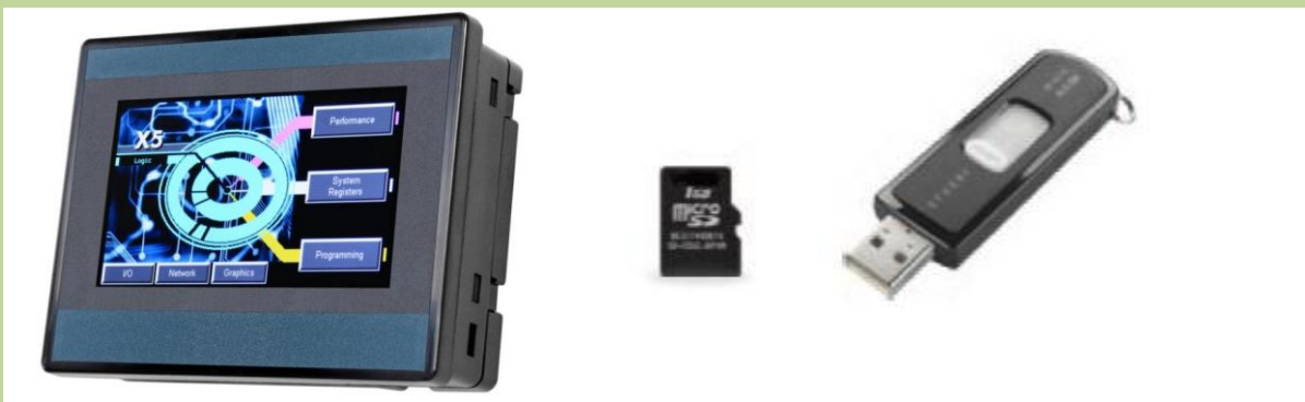
CONTROLADOR X5 REGISTRO DE DATOS, ALARMAS REMOTAS VIA EMAIL, VISUALIZACION DE DATOS POR ETHERNET Y EXTRACCIÓN DE DATOS VÍA USB.