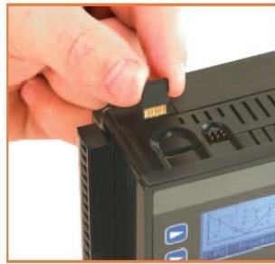
CONTROLADOR INTELIGENTE XE CON DATALOGGER EN MEMORIA MICROSD